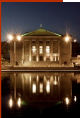
Teatr Wielki im. S. Moniuszki w Poznaniu

Szlachetność wzrusza w każdym narodzie i w każdych czasach, dlatego „Halka” Moniuszki jest nadal aktualna i to na wszystkich kontynentach.